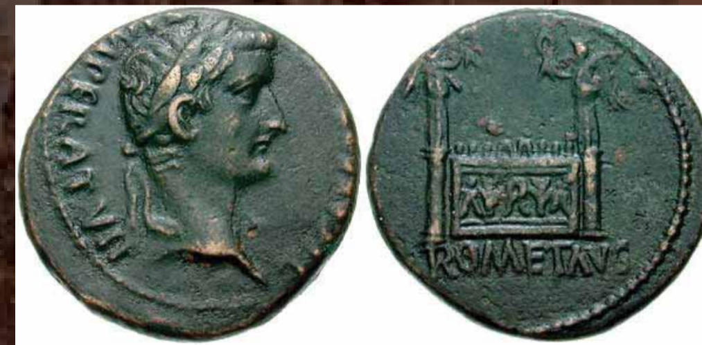
frappé sous Tibère 14 ap. J.-C. TI CAESAR [AVGVST] F IMPERAT VII, ROM ET AVG, Autel du sanctuaire fédéral de Lugdunum

C'est la qualité de la représentation, due à l'exceptionnel talent du graveur, qui fait son intérêt.