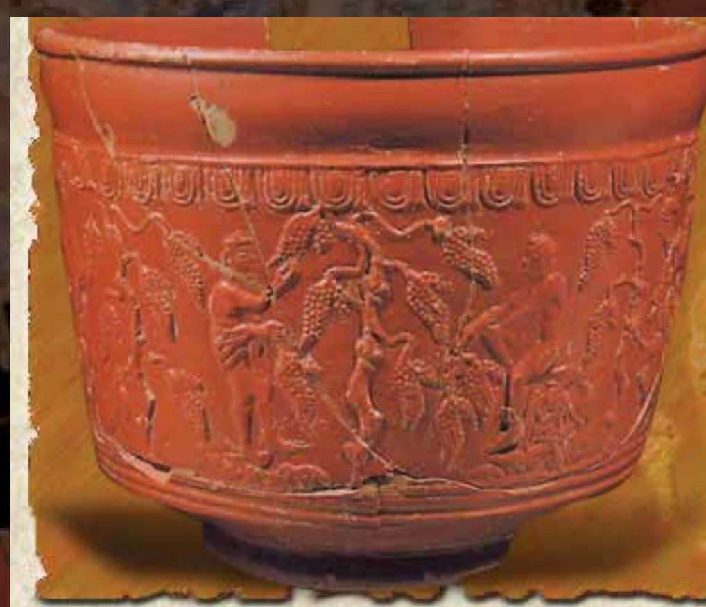
Engobe brillant Céramique sigillée à pâte fine orangée caractéristique du style d'Arezzo.

A l'arrivée au port, les marchandises étaient transportées dans des entrepôts et continuaient leur voyage par le fleuve.