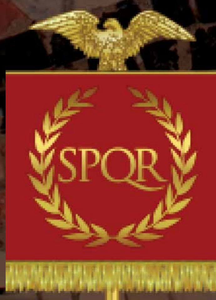
Vexillum avec l'aigle et le sigle de l'état romain.

Chaque légion se trouve sous les ordres des officiers : les centurions. Peuvent monter dans la hiérarchie jusqu'au rang de primipile , celui qui a l'honneur de veiller sur l'enseigne de la légion. Les centurions donnent leurs ordres aux sous-officiers, les principales , qui eux-même commandent aux légionnaires.