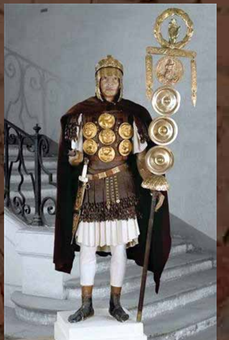
Tribun militaire romain portant une enseigne Musée de l'Armée, Paris

Armés plus légèrement pour garder la mobilité tactique, les cavaliers portent un bouclier et une ou plusieurs lances. Comme dans les autres domaines, les Romains empruntent aux peuples ennemis le meilleur de leurs techniques militaires.